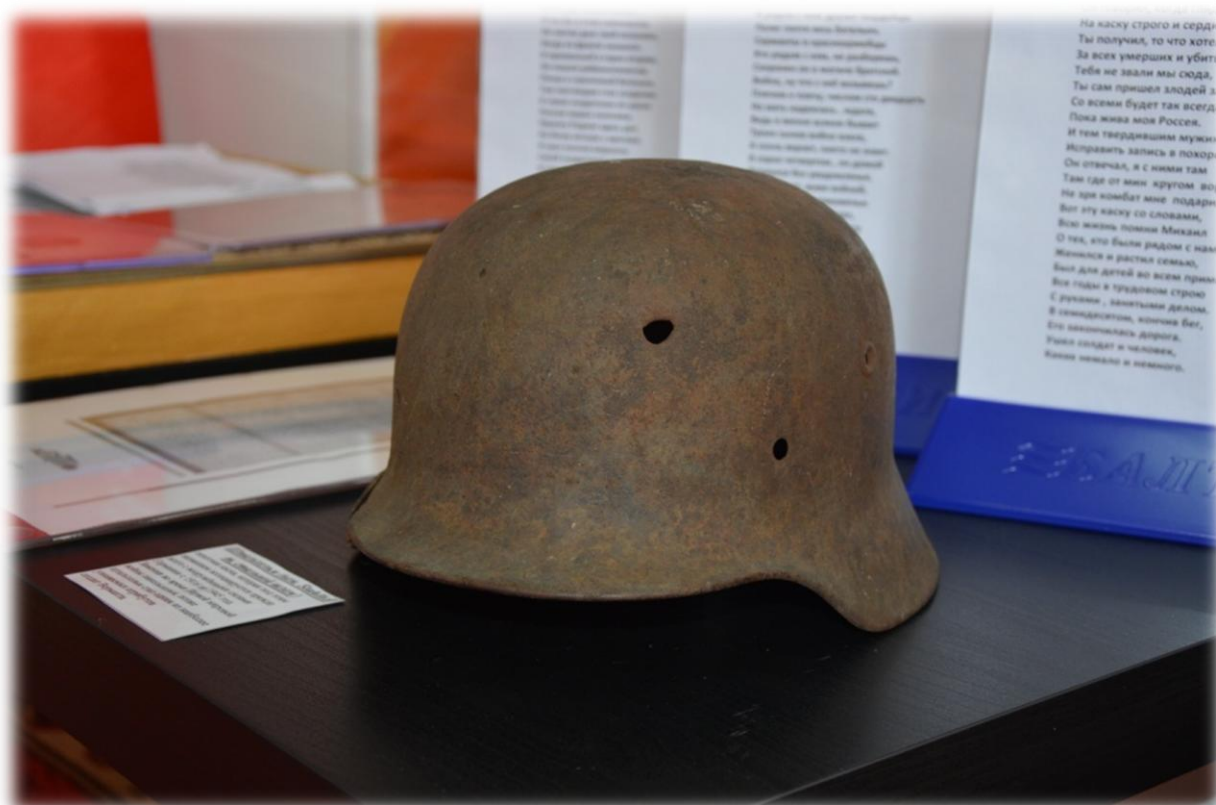
Немецкая каска – экспонат комнаты Боевой Славы школьного музея МБОУ «Тугнуйская СОШ»